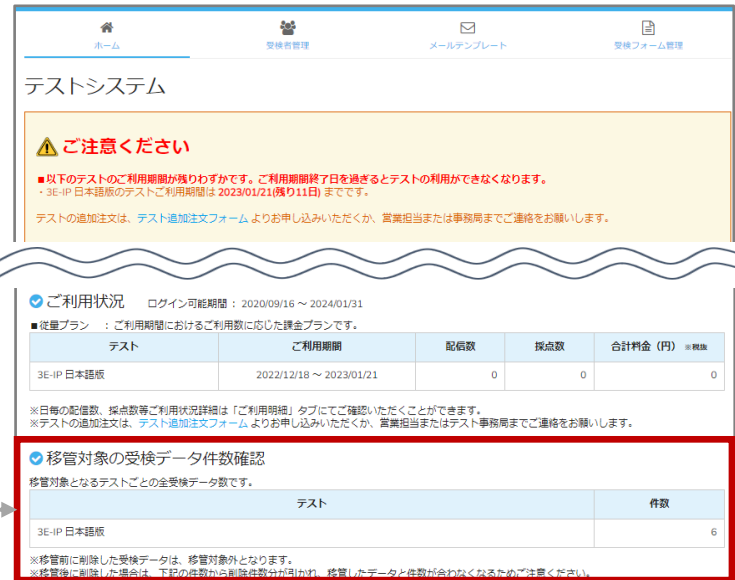
図1 3Eテストシステム